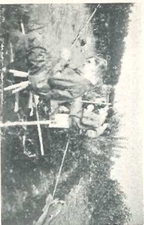
De visclub in actie.